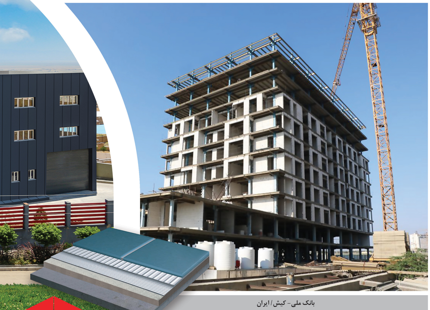
بانک ملی - کیش / ایران