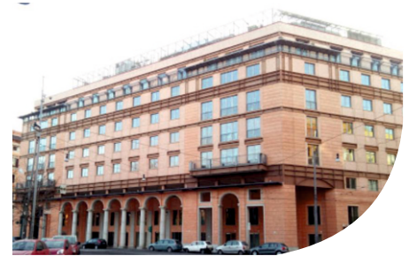
POST OFFICE - CATANIA