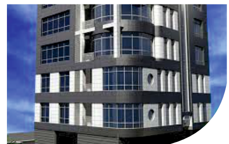
Bahar Shopping Center - TEHRAN