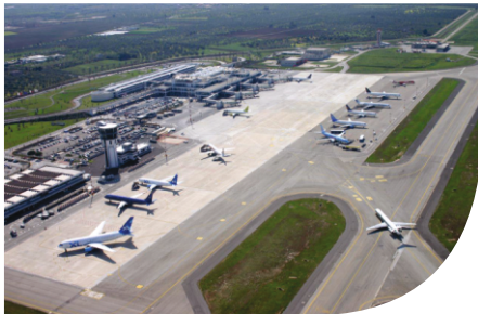
AIRPORT - BARI