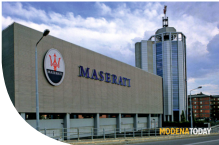
MASERATI FACTORY - MODENA