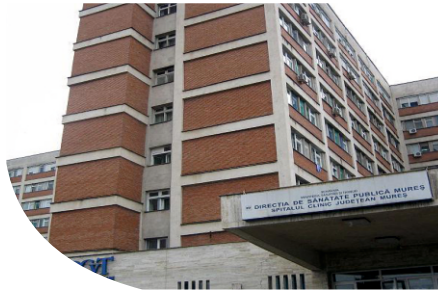
HOSPITAL - ROMANIA