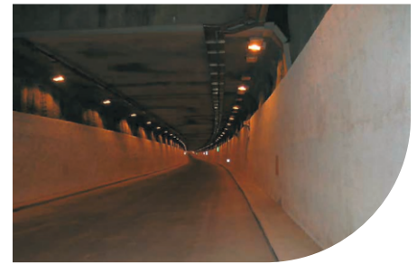
"CIRCONVALLAZIONE NORD" TUNNEL LINING - ROME