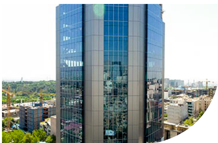
Jahan Koudak Insurance Building-TEHRAN