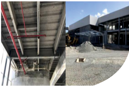
INDUSTRIAL Building - PANAMA

PROTHERM light® HAS BEEN USED IN ALL DIFFERENT TYPES OF BUILDING AROUND THE GLOBE EDILTECO REFERENCES